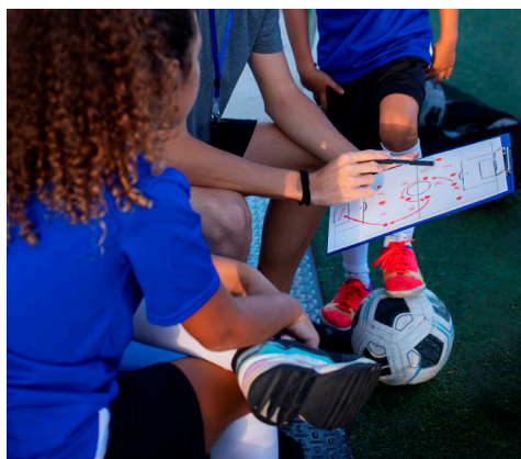
Figura 21. La figura del entrenador o entrenadora en el deporte formativo tiene una gran influencia en la determinación moral de sus jugadores y jugadoras

Los entrenadores y entrenadoras que se ocupan de la formación deportiva son personas de gran influencia para los niños, niñas y los adolescentes, con lo que todas sus actitudes y acciones influenciarán de manera directa en los comportamientos de los y las deportistas (Nery et al., 2020a). En ocasiones, incluso son percibidos como modelos, por lo cual tienen un papel crucial en la determinación de las acciones morales de los jugadores y jugadoras (Gendron & Frenette, 2016).