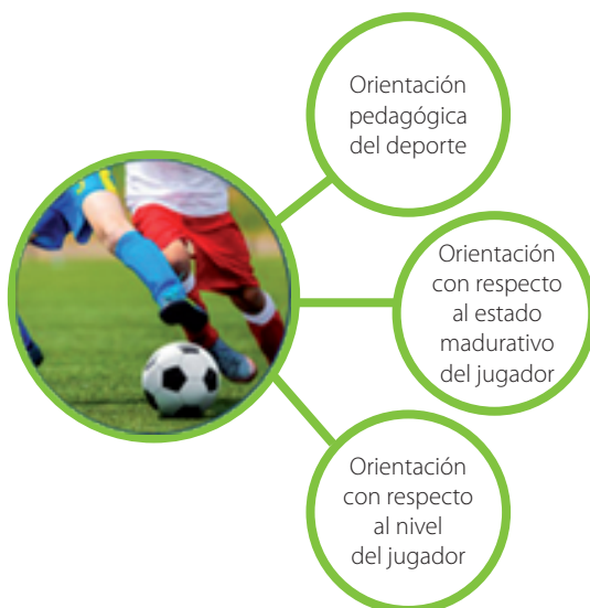
Figura 1. Criterios organizativos y conceptuales sobre los que definir el fútbol base

Para entender el concepto de fútbol base y tras consultar los diferentes autores revisados (Ardá y Casal, 2003; Blázquez, 1999; Chesnau y Duret, 1995; Fradua, 2005; Garganta, 2003; Garganta y Pinto, 1998; Lago, 2002; Leali, 1994; Lorenzo, 2007; Martín-Barrero, 2019; Moreno y Fradua, 2001; Ortega, et al., 2015; Pacheco, 2004; Sans y Frattarola, 1999; Sebastiani y Blázquez, 2012; Wein, 2000, 2004), se puede llegar a la conclusión de que el concepto de fútbol base o fútbol formativo está marcado por el «tiempo», en referencia al momento, etapa o fase se encuentra el niño o joven: