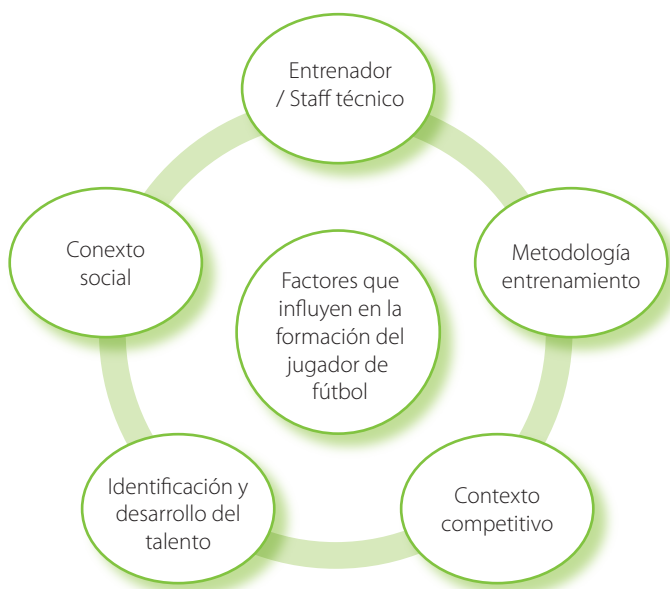
Figura 7. Variables relacionadas con el proceso de formación del jugador de fútbol

Por lo tanto, se puede considerar que las diferentes variables mencionadas anteriormente conforman al menos una parte de esa compleja y amplia red de elementos que formarían los diferentes factores influyentes dentro del proceso de formación deportiva de un jugador de fútbol (Figura 7).