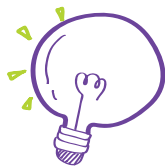
Icono Conceptos y fundamentos

Este primer símbolo representa el relato de experiencias prácticas innovadoras , es decir, modos y maneras que se han puesto en marcha en situaciones auténticas por profesores y profesoras innovadores. Recorrerás por distintas situaciones reales, del día a día, descubrirás la forma en que los docentes intervienen y se relacionan con su alumnado.