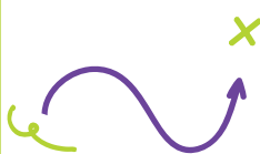
Icono Acción ¿Cómo empezar con mi Educación Física?

El tercer símbolo representa el procedimiento o proceso utilizado. Descubrirás las estrategias y herramientas que la educación del s. XXI utiliza para hacer realidad el cambio en su día a día. Te ayudaré a conocer el cómo, los métodos y procesos didácticos de aplicación.